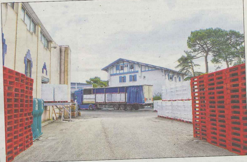
La source emploie désormais près de 40 salariés.

La firme arcachonnaise vient d'achever la modernisation de sa principale ligne de production cette semaine... Et entame la réfection complète de sa seconde unité, destinée à sa bouteille haut de gamme, "La Bordelaise".