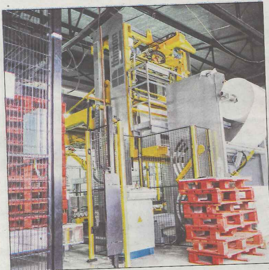
Les nouvelles installations post-étiquetage.